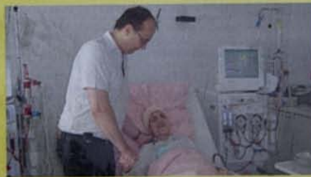
Auch mit 95 Jahren ist eine Dialyse sinnvoll.