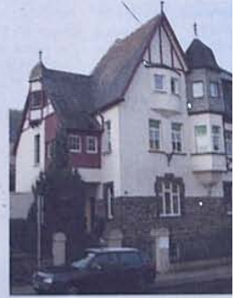
Das Dialysezentrum in der Adenauer Hauptstraße 16.

Dialysebehandlung in der Praxis in Bad Neuenahr-Ahrweiler: Montags, mittwochs und freitags in drei Schichten zwischen 6 Uhr bis 0.30 Uhr Dienstags, donnerstags und samstags jeweils von 6 bis 14 Uhr.